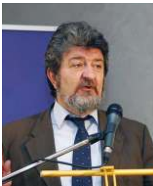
Σίμος Δανιηλίδης Δήμαρχος Νεάπολης-Συκεών